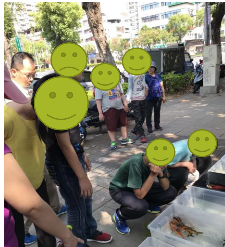
各班不定期舉辦戶外教學~假日花市