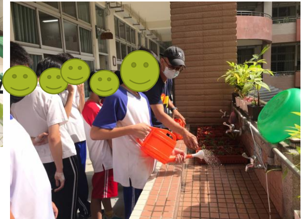
外聘師資課程~園藝