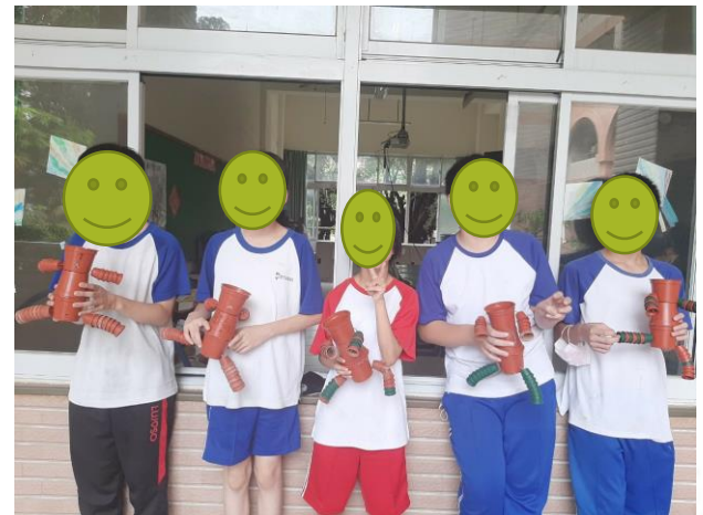
外聘師資課程~園藝