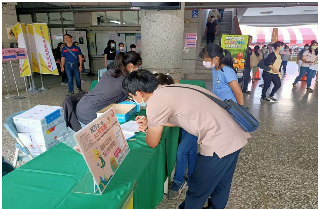
服務台輔導考生問題